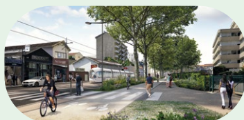
Avenue Roger Salengro, Villeurbanne

1 – Le prolongement de la ligne T6, c'est seulement un projet de transport en commun ?