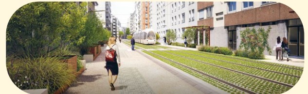
Rue Verlaine, Villeurbanne

Retrouvez l'actualité des travaux et les plans de circulations à jour sur SYTRAL.FR